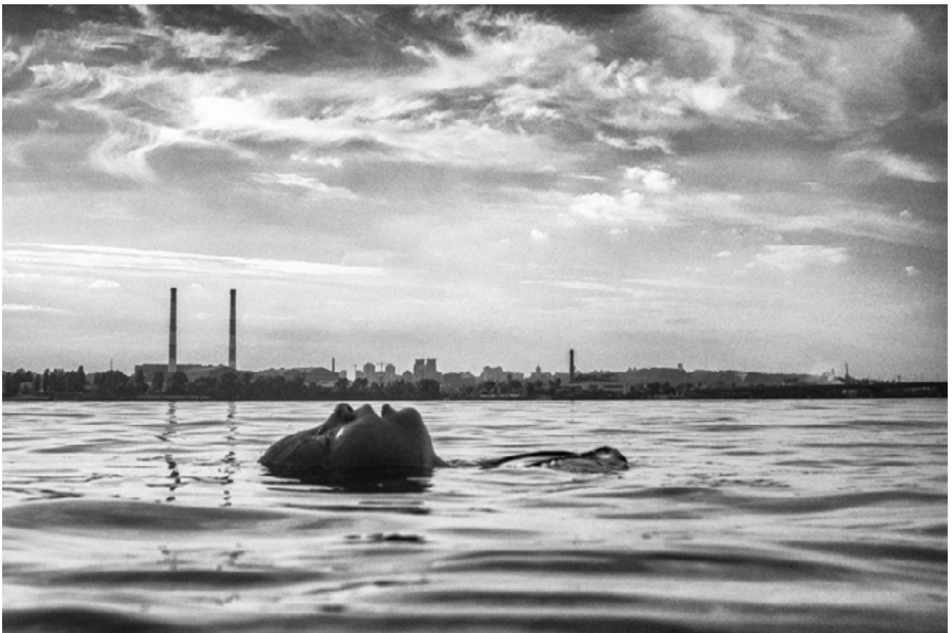
© Andriy Lomakin – Calm Waters

Pour défendre les valeurs de démocratie, de liberté d'expression et de paix, le réseau Diagonal, ses membres et en partenariat avec Kateryna Radchenko, fondatrice et directrice du festival Odesa Photo Days, proposent ensemble un cycle d'expositions et de rencontres mettant à l'honneur, dès le mois de mai et jusque fin 2023, la scène artistique et photographique ukrainienne.